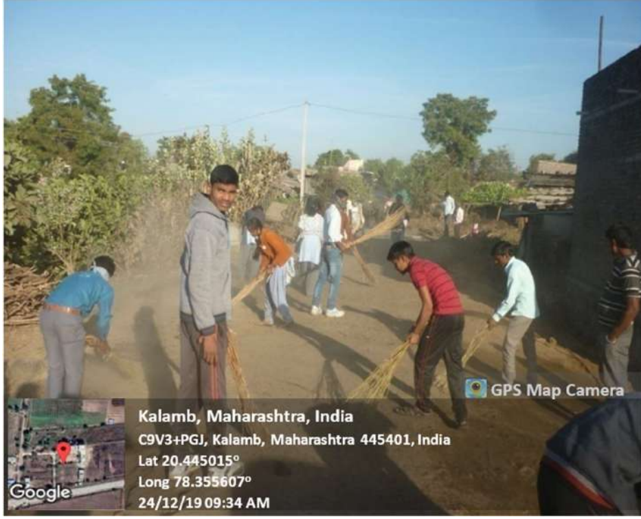
NSS Unit Organized a Cleanliness Drive in Kalamb