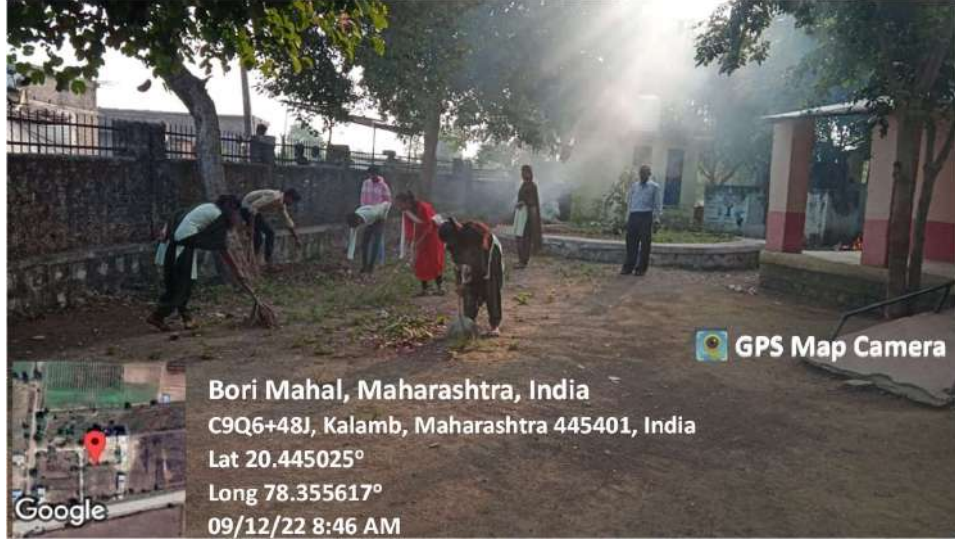
Participants Engaged in Cleanliness Drive at Bori Mahal