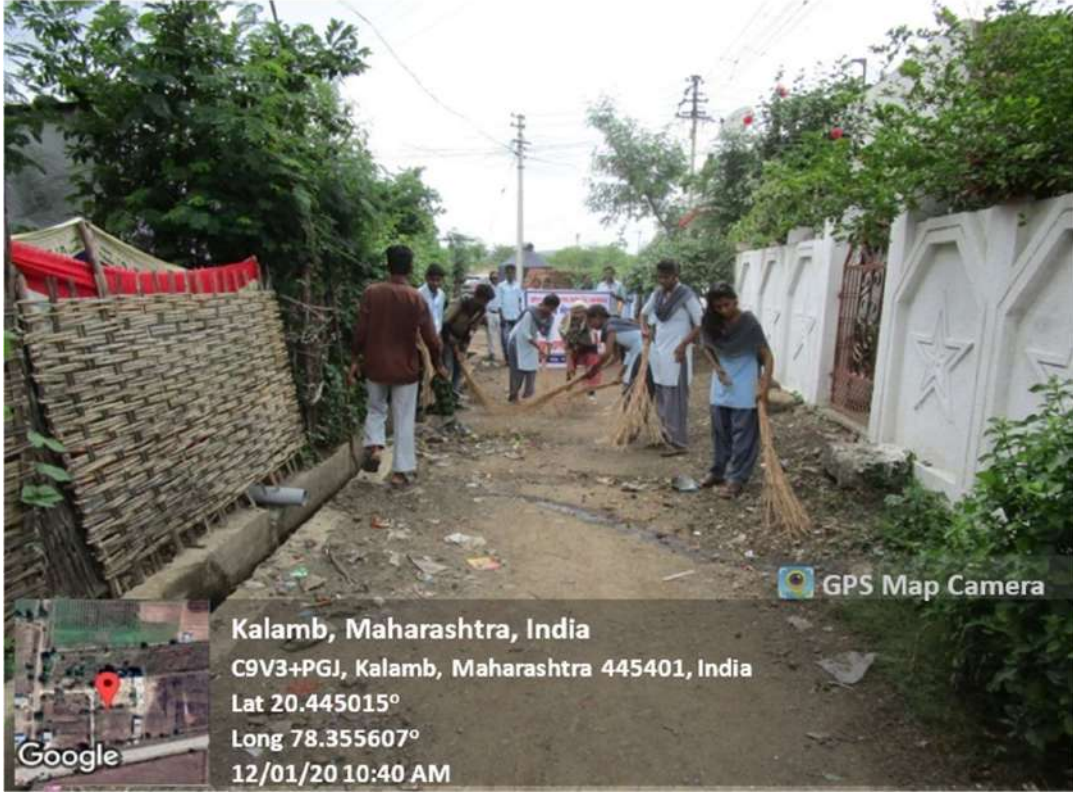
Cleanliness Drive in Bori Mahal NSS Unit Organized a Cleanliness Drive in Bori Mahal