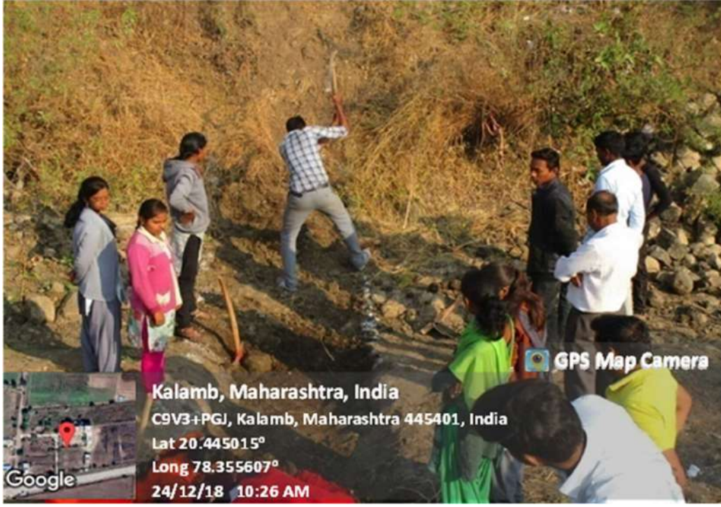
Snapshots During the Construction of Bund