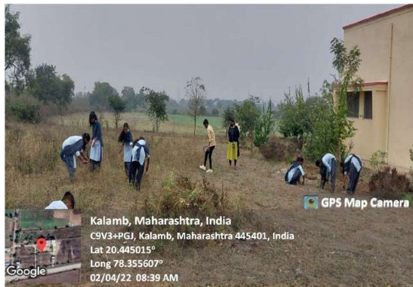
Particeipants Removing the Ganjar Gavat

Organized by N.S.S. UNIT, INDIRA MAHAVIDYALAYA, KALAMB DIST. YAVATMAL