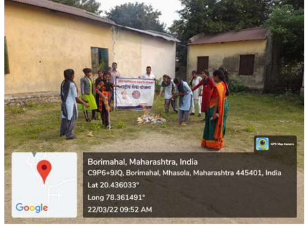
Participants Engaged in Collecting Plastic Waste