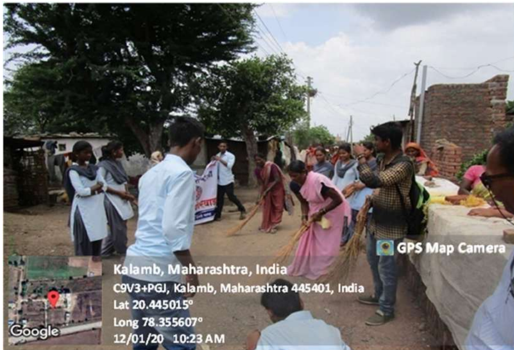
Cleanliness Drive in Bori Mahal

ORGANIZED BY N.S.S. UNIT INDIRA MAHAVIDYALAYA, KALAMB DIST. YAVATMAL